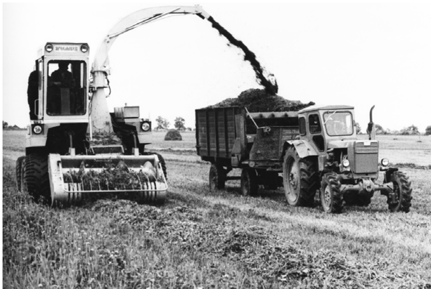
Кормоуборочный комбайн «Ярославец». Начало 1980-х гг.