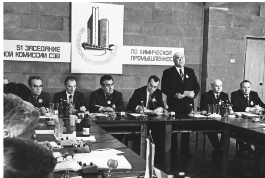
Заседание постоянной комиссии СЭВ по химической промышленности в г. Ярославле. 1977 г.