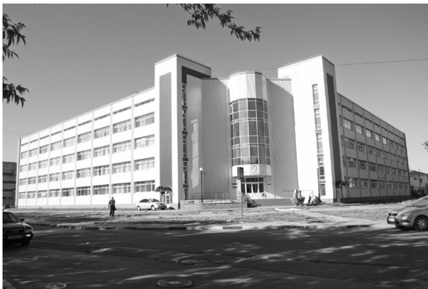
Бизнес-инкубатор Ярославской области, созданный для государственной поддержки малого и среднего бизнеса.