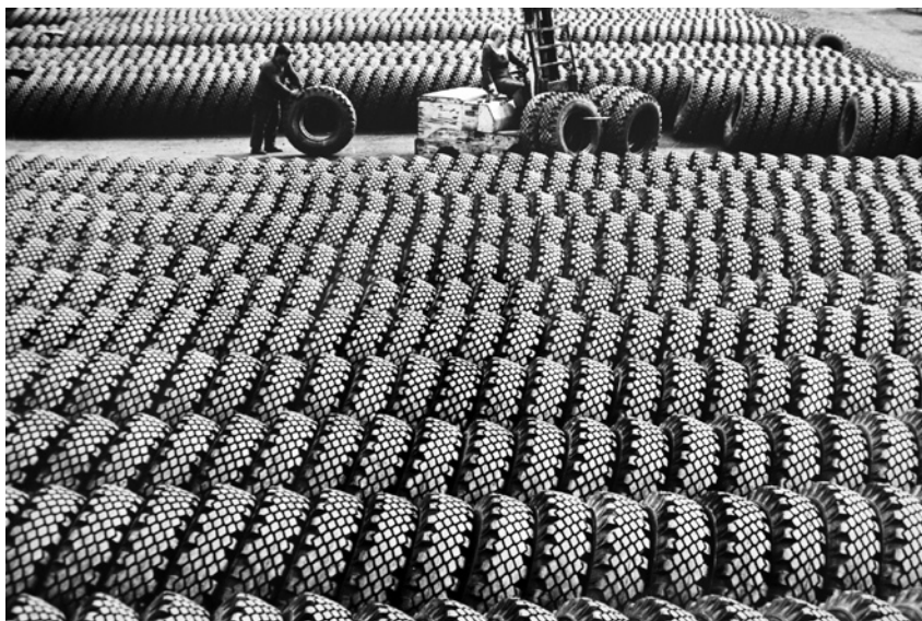
Продукция Ярославского шинного завода. 1975 г.