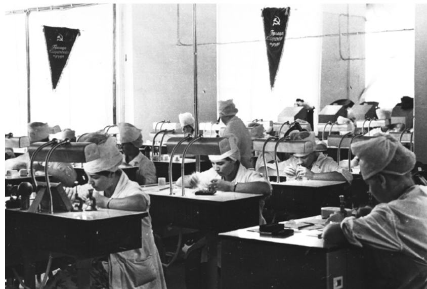
На Угличском часовом заводе. 1965 г.