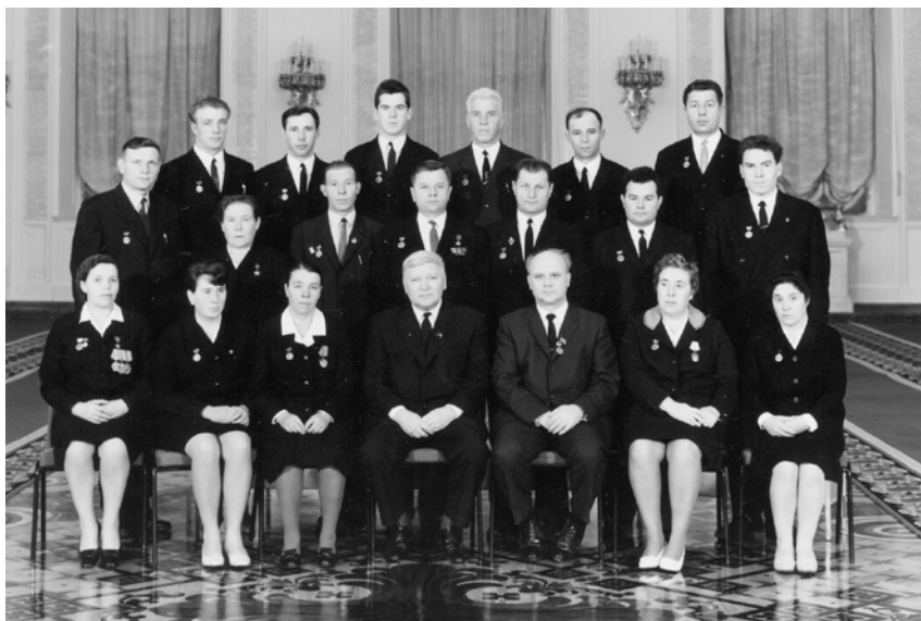
Третий Всесоюзный съезд колхозников. 25–27 ноября 1969 г.