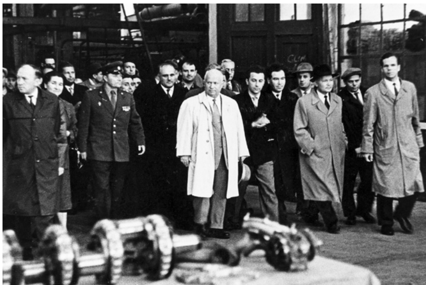
Н. С. Хрущев на Ярославском моторном заводе. Июнь 1963 г.