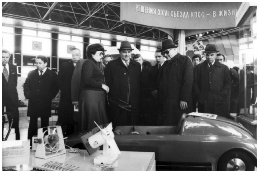
М. С. Горбачёв в выставочном комплексе ЦНТИ. Июнь 1982 г.