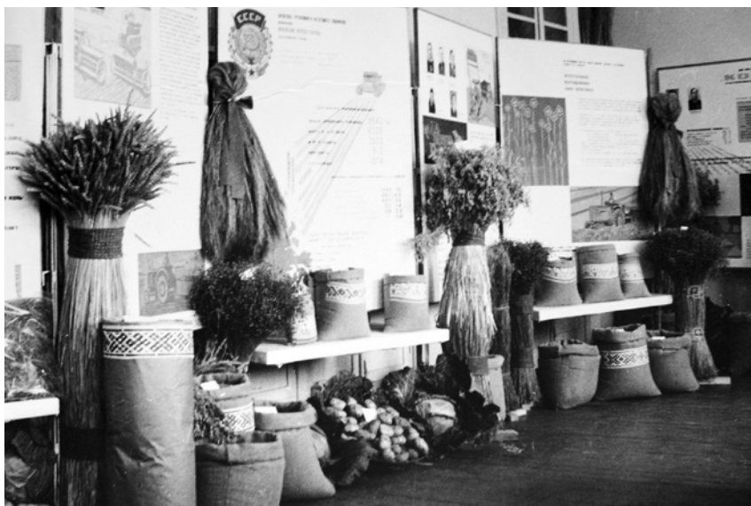
Ярославская областная сельскохозяйственная выставка. Октябрь 1970 г.