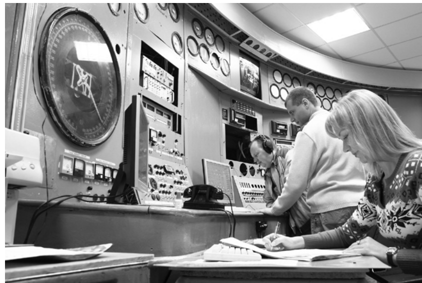
НПО «Сатурн». Государственные стендовые испытания двигателя М75РУ.