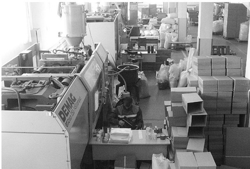
Предприятия ООО «Унипласт-Ростов» — производство различных изделий народногохозяйственного и технического назначения из пластмасс.