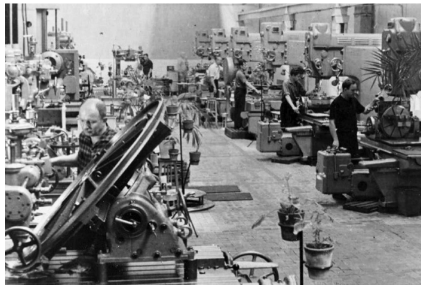
На Рыбинском моторостроительном заводе. 1969 г.