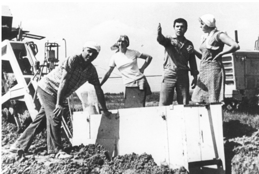
Мелиораторы ПМК-17 на Антроповском массиве Ярославского района. 1979 г.