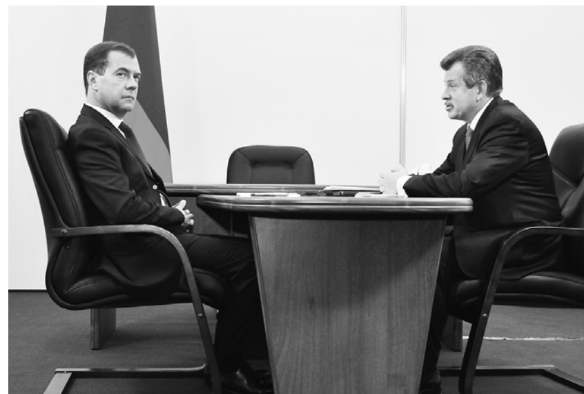
Беседа Президента России Д.А. Медведева с губернатором Ярославской области С.А. Вахруковым. 10 сентября 2010 г.