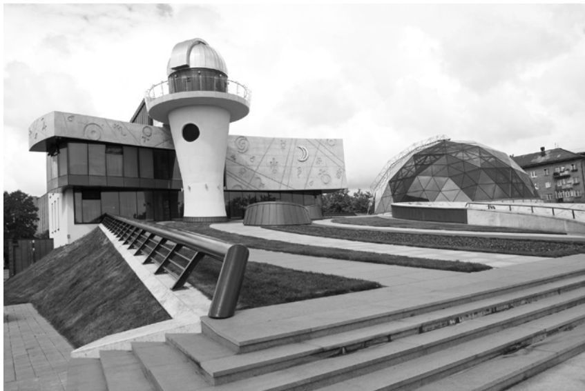
Культурно-образовательный центр им. В.В. Терешковой (Ярославский планетарий).