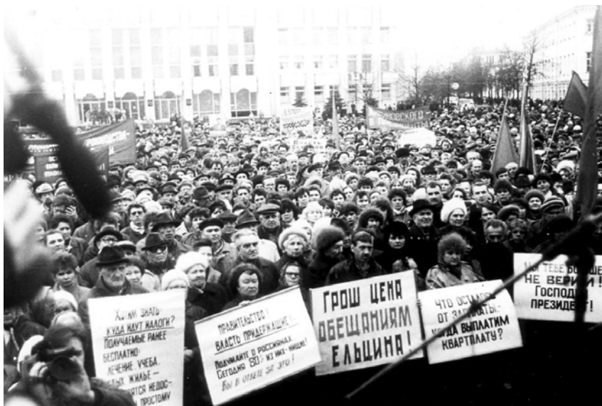
На одном из многочисленных митингов 1990-х гг.