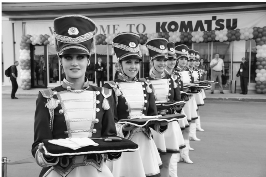
На торжественном открытии завода Комацу по сборке экскаваторов и автопогрузчиков. Лето 2010 г.