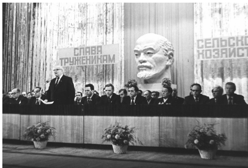
Торжественное собрание, посвященное труженикам сельского хозяйства Ярославской области. Октябрь 1980 г.