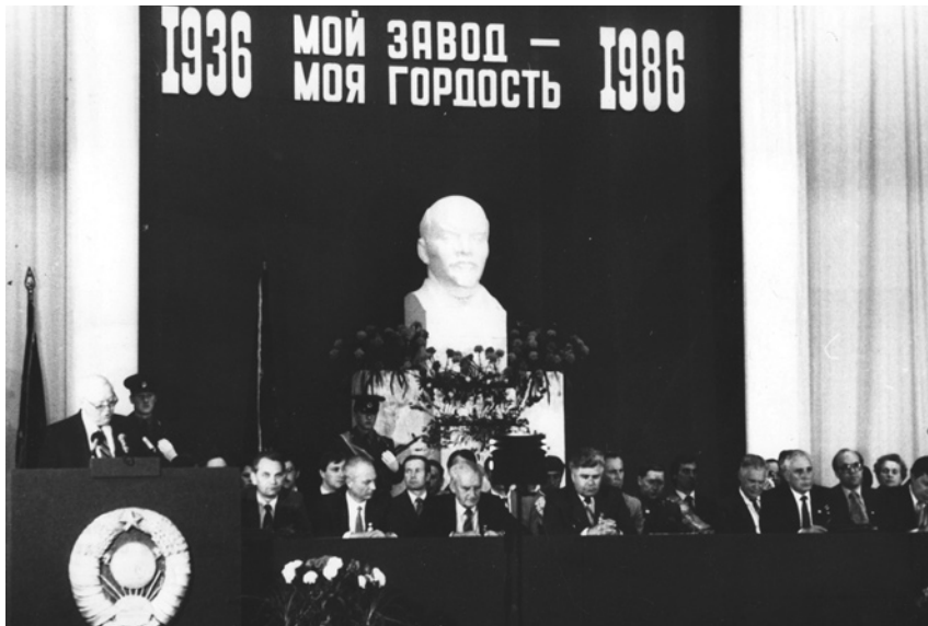
50-летие Волжского машиностроительного завода. Апрель 1986 г.

Рыночные преобразования привели к серьезным структурным изменениям в экономике области, сопровождавшимся резким падением жизненного уровня значительной части населения.